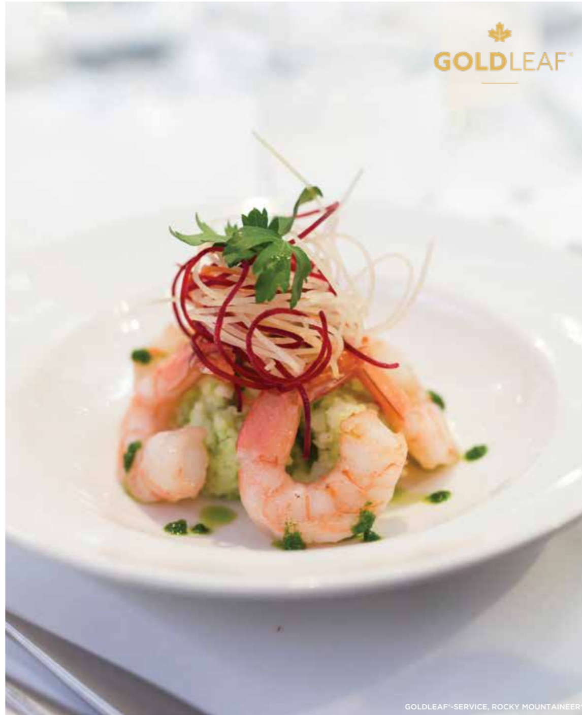
GOLDLEAF®-SERVICE, ROCKY MOUNTAINEER®