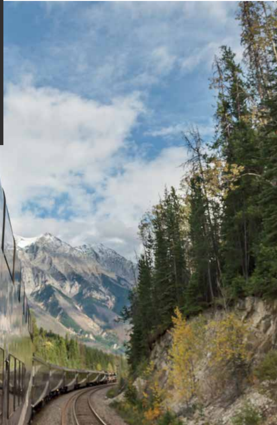
AUSSICHTSPLATTFORM, ROCKY MOUNTAINEER®